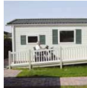
Chalet voor mindervaliden