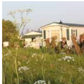
Chalet met vrij uitzicht