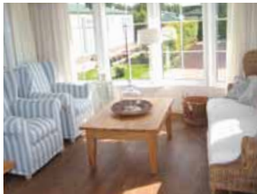
Chalet van binnen